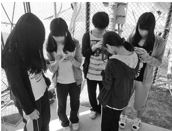
図6. 授業風景 (指示がなくても授業開始前に前回の確認や過大の確認を行うようになった)

スポーツにおける技術習得では「映像からのフィードバック」の効果が高いことは先行研究により示唆されている。ただしこれらの先行研究の多くは「限られた時間内に大人数」で行うことは想定されていない。本実践は「履修生自身が学習成果を蓄積させることができる」「学習成果をなくさない」「特別な機器を準備することなく振り返り学習が行える」という点において非常に有用であったと考えられる。教員側としては「写真・動画の撮影、編集、管理作業がなくなる」ことで負担の軽減が期待できる。また、各履修生の学習記録が蓄積されている Google Drive にアクセスすることにより、履修生の理