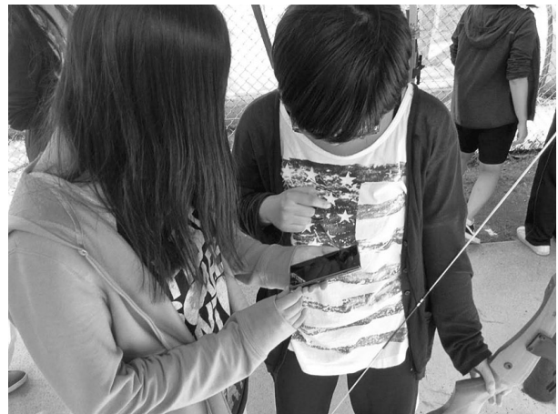
図2. 授業風景(撮影された映像を用いて即時フィードバックを行う)