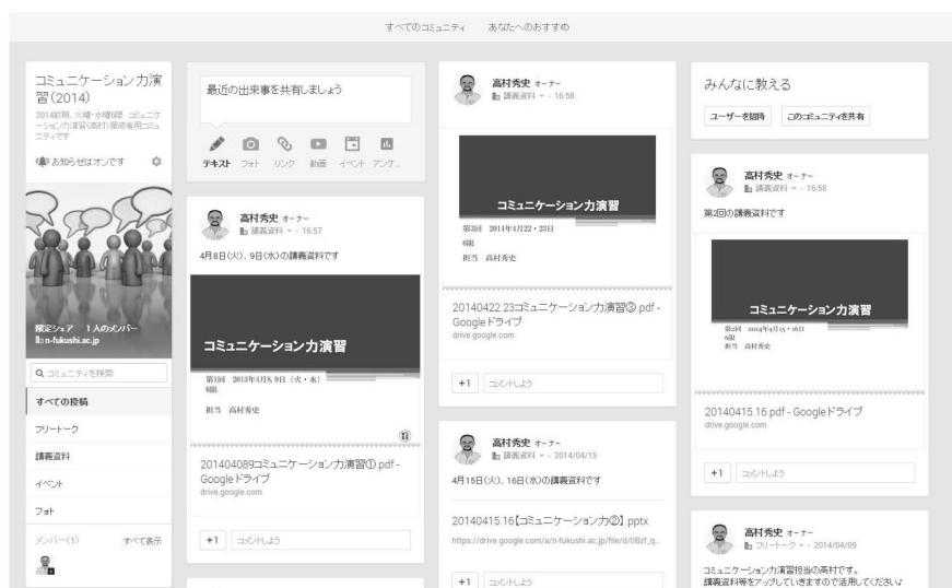
図3. コミュニケーション機能を活用した学生への資料提示