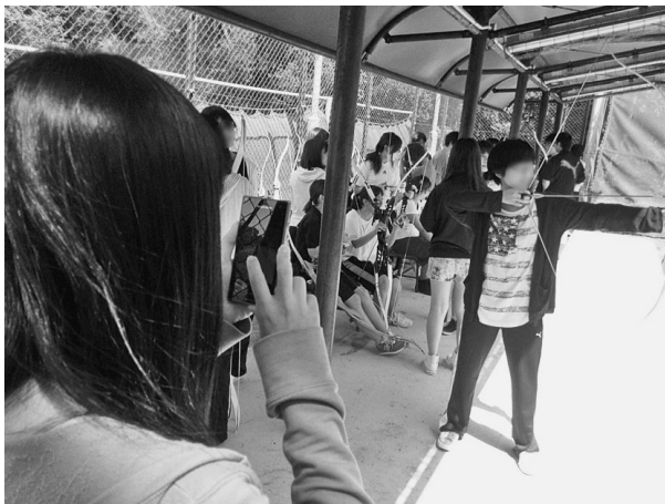
図1. 授業風景(お互いに撮影を行う)