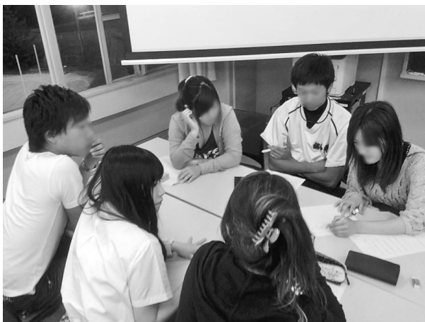
図4. 授業風景(演習のため、教員は学生の中を動き回って講義する必要がある)

本実践の対象は2年次に開講される文章作成力演習である。2011年に開講され本学のICTサービスの充実と